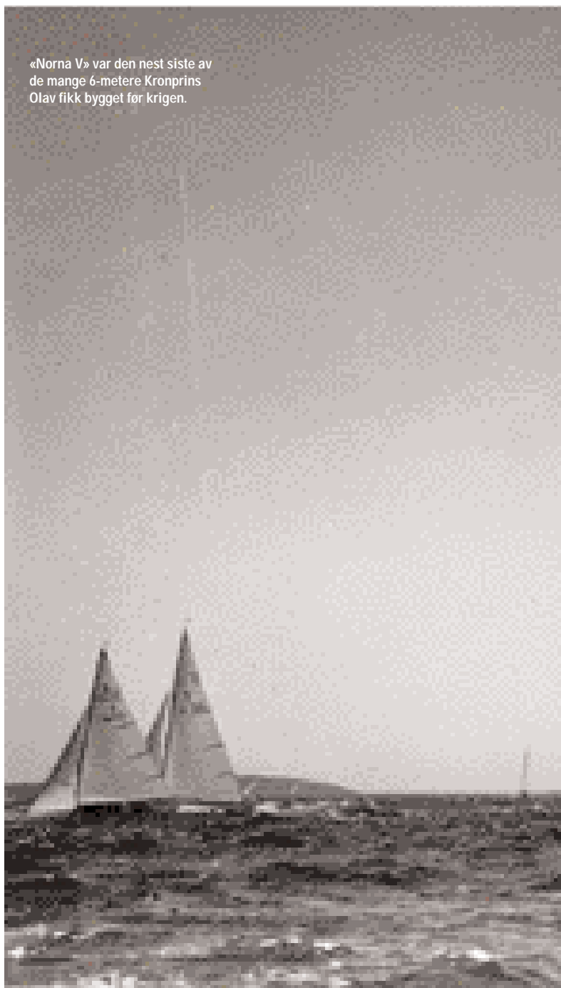
«Norma V» var den nest siste av de mange 6-metere Kronprins Olav fikk bygget før krigen.

Fra 1985 tok interessen for 5,5 meter klassen seg opp her