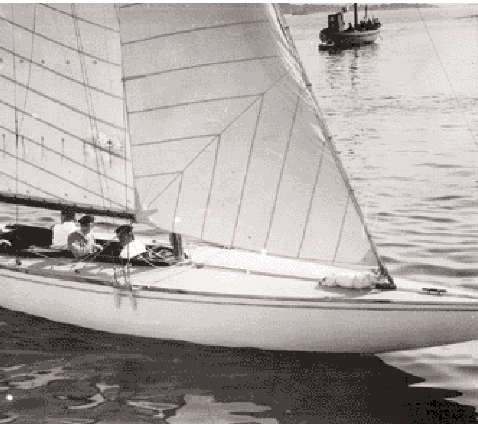
«Oslo» var Kronprins Olavs første 6-meter.