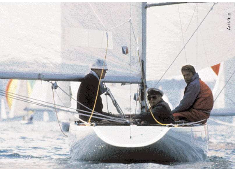
I 1971 kjøpte Kongen 5,5 meteren «Bingo» i USA.

under VM endte nybygget på 5. plass. I 1981 tok Kongen The Duke of Edinburgh Cup på Bahamas med båten.