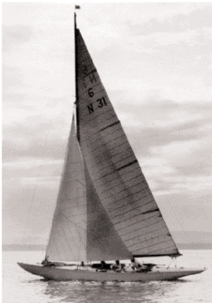
«Norma» vant Olympisk gull i Antwerpen i 1928 med Kronprins Olav som mannskap. Kronprinsen hadde vunnet uttagningene, men insisterte på at konstruktøren Johan Anker skulle styre under selve OL-seilasene